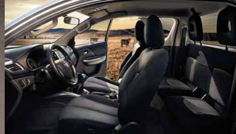
ИНТЕРЬЕР С ОТДЕЛКОЙ ИЗ ТКАНИ.