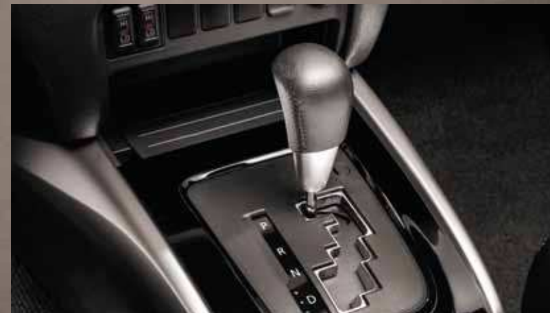
АВТОМАТИЧЕСКАЯ КОРОБКА ПЕРЕДАЧ.