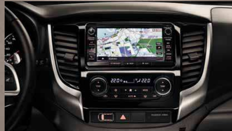
МНОГФУНКЦИОНАЛЬНАЯ АВТОМАГНИТОЛА С СЕНСОРНЫМ ДИСПЛЕЕМ И УПРАВЛЕНИЕМ НА РУЛЕ.